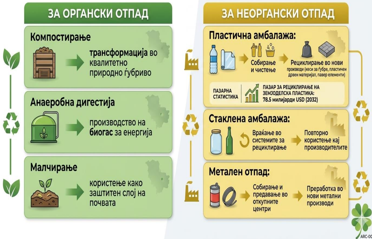
ГРАФИК: СИСТЕМ ЗА РЕЦИКЛИРАЊЕ